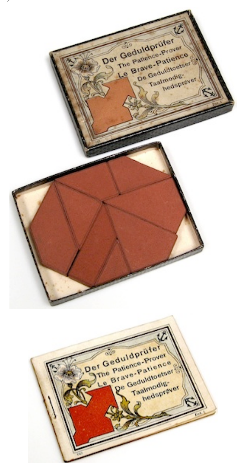
(cardboard box 3.1" x 4.1" x 1/2", 8 stone pieces, and booklet; similar booklet with the same shapes as the version on the previous page)