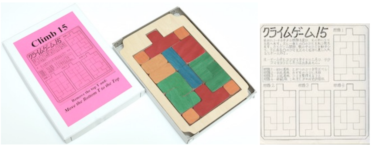
Designed and made by Minoru Abe, circa 1985. (cardboard box 7+7/8" x 5.5" x 3/4" with wood tray and 15 wood pieces, 7+7/16" x 5+1/8" x 9/16")

The puzzle has these pieces (a second red T-piece is a keeper piece to be removed):